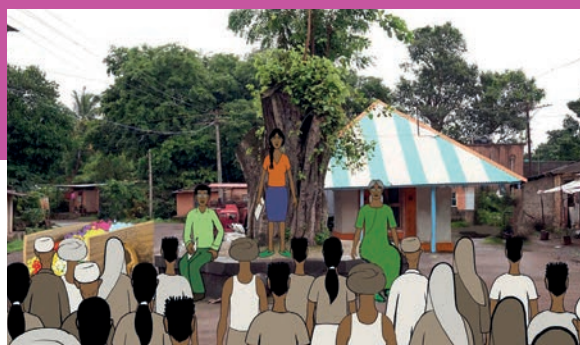
Eindrücke aus den digitalen Escape Games